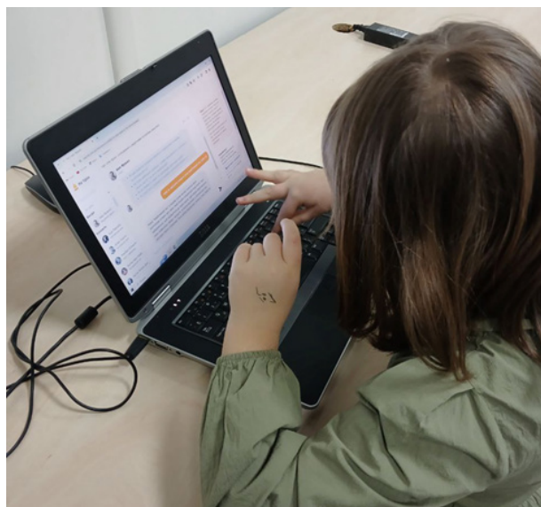
Рис. 1. Процес роботи з Chat GPT при проведенні уроків на теми «Написання листа» та «Творення складних слів. Авторська казка»

Для формування досліджуваного уміння на уроці української мови учні повинні обрати 10 фразеологізмів та описати їх значення, а потім звернутися до чату і запитати в нього тлумачення цих висловів. За допомогою вправи на розвиток критичного мислення «Вірю – не вірю» учням запропоновано порівняти власне розуміння з відповідями, які надав Chat GPT.